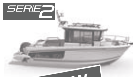
Merry Fisher 795 marlin