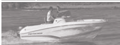
Cap Camarat 5.5 CC