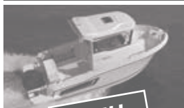
Merry Fisher 605 marlin